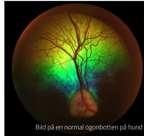
Bild på en normal ögonbotten på hund

CHERRY EYE En framfallen tårkörtel, cherry eye, åtgärdas kirurgiskt genom att den framfallna körteln återförs och sys fast i rätt läge innanför tredje ögonlocket. Då slemhinnan där körteln sys fast är tunn och skör, finns risk att körteln faller fram igen. I sådana fall kan operationen behöva göras om.