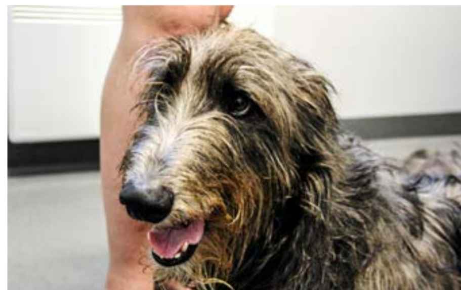
Dougall har klarat sig bra i värmen hittills.