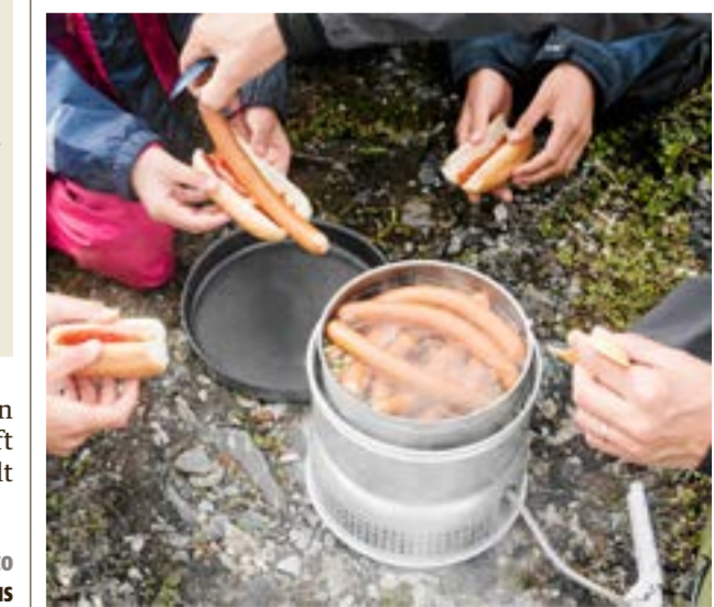
Friluftskök, även kallat stormkök, får användas vid camping. Helst ska köket placeras på ett underlag som inte kan brinna, det vill säga på en stenhäll eller bar mark utan vegetation.