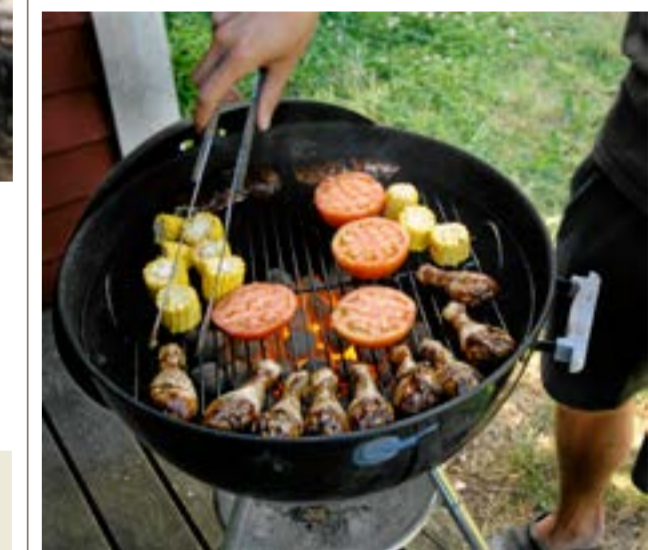
Grillning med ändamålsenlig grill i egen trädgård är tillåten trots förbudet.

Innan man lämnar platsen måste man vara helt säker på att ingen brand kan uppstå efter användningen av köket. Marken under köket måste ha svalnat och det får inte finnas några andra tecken, så som rök, på att en eld skulle kunna uppstå efter matlagningen.