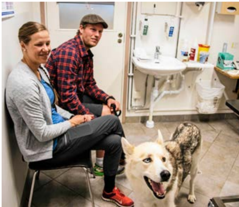
Efter fem minuter är avmaskningen klar, och Storm är redo för att åka.

Storm tycker om att följa med, så det är klart han ska det.