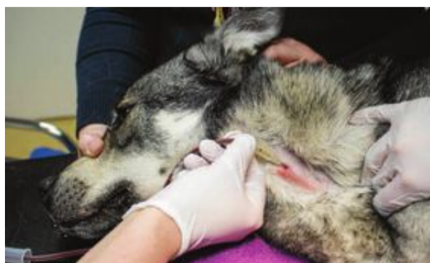
När blodet tappas används ingen bedövning. Men djurvårdaren ser hela tiden till att hunden inte blir rädd eller obekvämd.