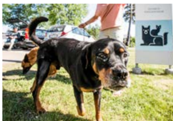
I början av maj firade djursjukhuset sina 30 år med öppet hus och även med att inviga nybyggda undersökningsrum.

klättrade på byggställningarna, berättar hon och skratrar. Och fler byggnadsställningar kring fastigheten har det blivit. Det positiva är att djursjukhuset fått bygga ut