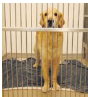
Den här vovven väntar på att matte ska komma.