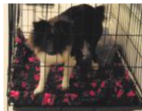
Här finns 170 vårdplatser.