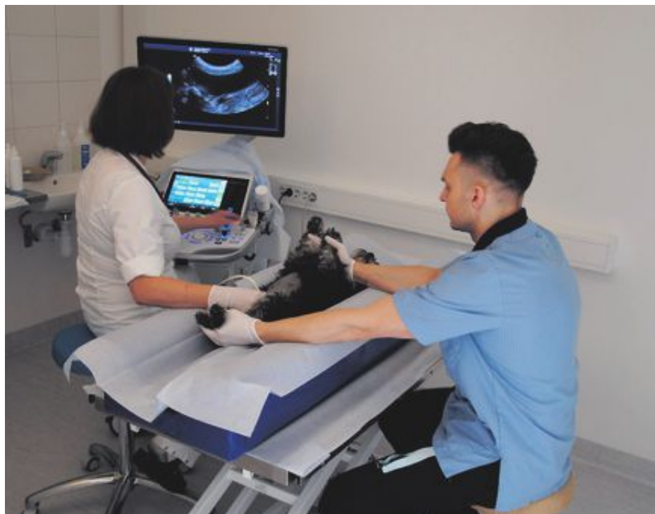
Veterinärerna på djursjukhuset undersöker magen på en tik med ultraljud.