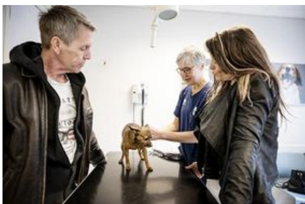
Hunden Saga, en blandning mellan en chihuahua och prazský, får en spruta med vaccin som räcker tre år ...