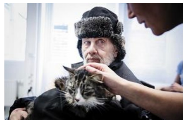
Allt såg fint ut för Caesar.