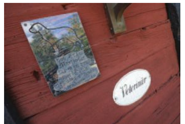
Sedan 1985 har djur behandlats i det röda timmerhuset.